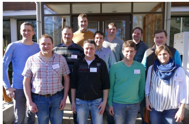
111. Grundkurs 2005