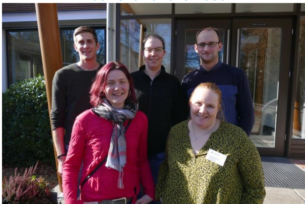
116. Grundkurs 2010