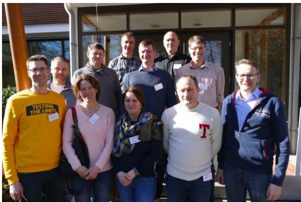
106. Grundkurs 2000

Die Grundkursler der Jahrgänge 2000, 2005, 2010 und 2015 feierten vom 08.-09.02.20 in Herrsching ein Wiedersehen. Unter dem Motto „ Landwirt im Rampenlicht “ gab es in verschiedenen Workshops wertvolle Impulse für das Auftreten und Wirken in der Öffentlichkeit, wie z. B. den professionellen Umgang mit Medienvertretern. Die Chance zum regen Austausch untereinander und dem Kennenlernen des aktuellen 126. Herrschinger Grundkurses wurde gerne genutzt. Der Samstag klang nach dem Konzert der „#Fridaysss“ – einer Vokalgruppe mit viel weiblicher Power - im Interimsbierstüberl aus. Am nächsten Tag diskutierten die Teilnehmer intensiv mit Stefan Köhler, dem Umweltpräsidenten des BBV, die aktuellen Herausforderung der Landwirtschaft.