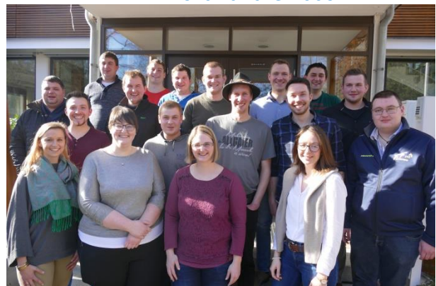
121. Grundkurs 2015